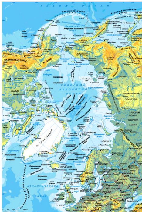
Рис. 1 – Современная физическая карта Арктики

Нумерация рисунков сквозная по всей работе. Например: Рис. 2 (второй рисунок). Пример оформления рисунка: